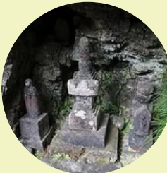
영수(보물인탑) 본당 뒤에 겐토 쿠 아침 무덤과 샘물이 있습니다.