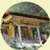
白山鎮守堂 (Hakusanntin nyudou)