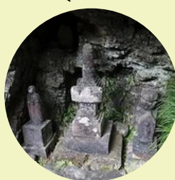
圣水 (法京院塔) 正殿后方是源赖朝の墓地和一处泉眼。