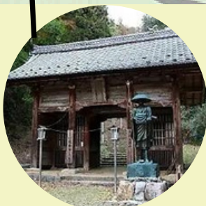
仁王門 (Nioumonn) 从仁王門到正殿有150米 (步行约5分钟)。