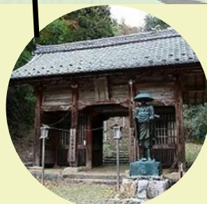
仁王門 (Nioumonn) 從仁王門到正殿有150公尺 (步行約5分鐘)。