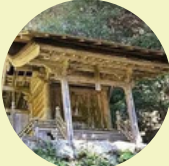
白山鎮守堂 (Hakusanntin njudou)