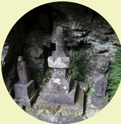
聖水 (法京院塔) 正殿後方は源頼朝の墓地 和一個泉眼。