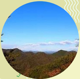
ハイキングコース (hiking course)